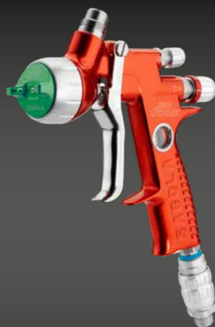
4600 XUREME HVLP