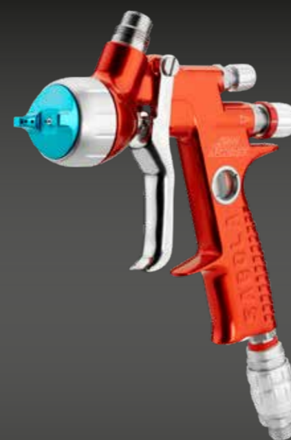
4600 XUREME AGUA