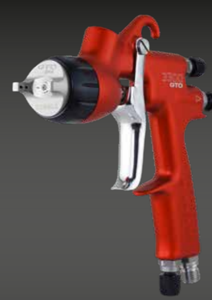
3300 GTO PRIMER