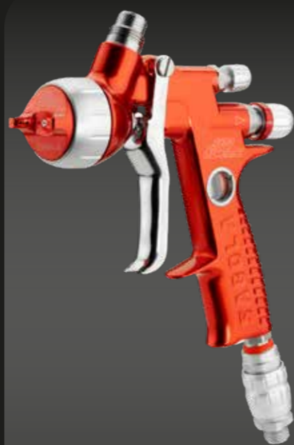
4600 XUREME HS