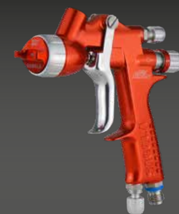
mini XUREME SPOT REPAIR